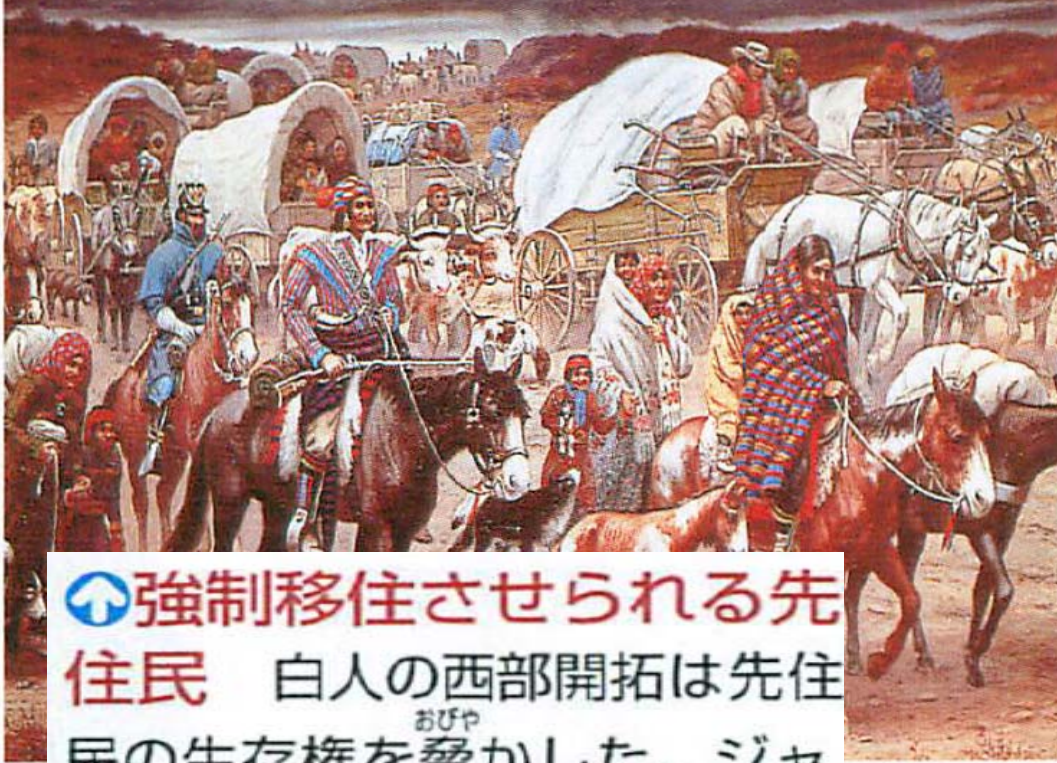
チェロキー族「涙の旅路」

↑強制移住させられる先住民 白人の西部開拓は先住民の生存権を脅かした。ジャクソン大統領は1830年の強制移住法で彼らをすべてミシシッピ川以西に追いやった。白人によるバッファローの乱獲は平原に暮らす先住民の食糧源を無くし、彼らの激しい抵抗を招いた。